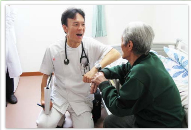
住み慣れたご自宅で診察を受けられるので安心

内科を中心に、精神科・皮膚科・整形外科の疾患においても訪問可能な専門医が在籍しており、高齢者に想定される様々な医療サービスを提供しています。