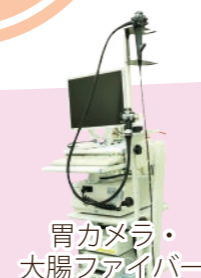
胃カメラ・大腸ファイバー