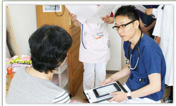
病状が急変した場合でも、24時間いつでも連絡が取れ、必要に応じて夜間や休日を問わず臨時往診に伺う体制をとっています。

緊急の場合、当院は勿論のこと協力医療機関との連携により迅速に救急搬送するなどの対応をいたします。